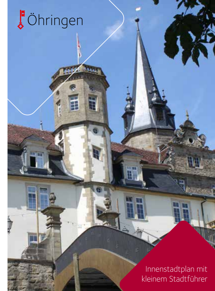
Innenstadtplan mit kleinem Stadtführer