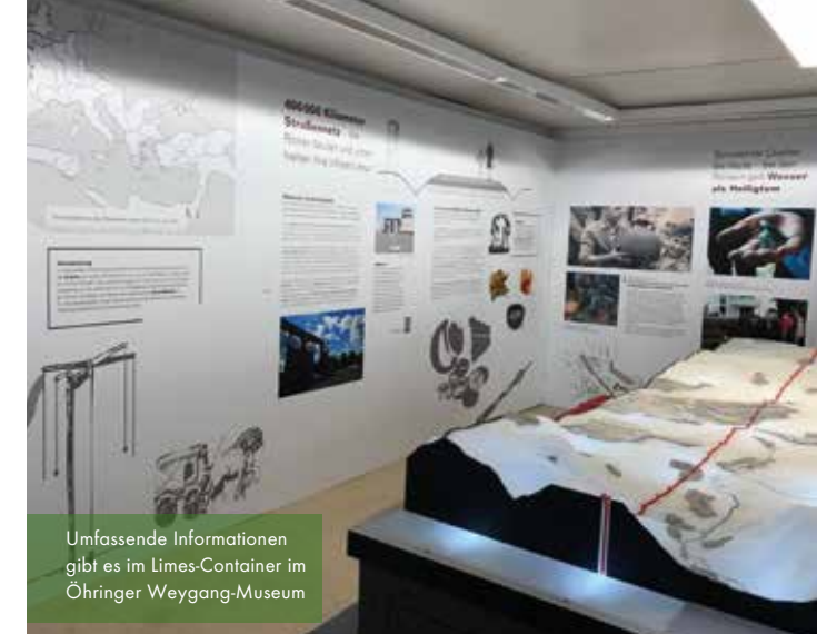
Umfassende Informationen gibt es im Limes-Container im Öhringer Weygang-Museum