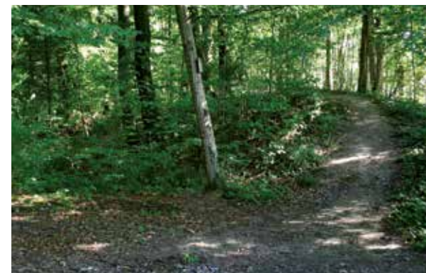
Wall und Graben im Wald bei Zweiflingen, am Pfahldöbel