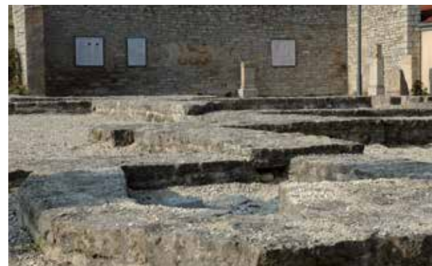
Kastellbad Jagsthausen