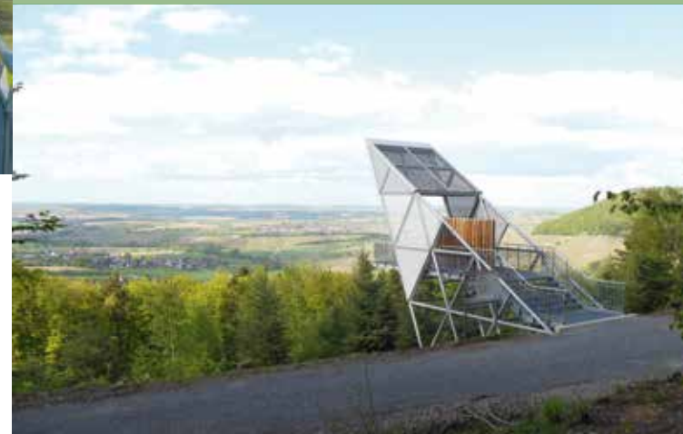
Limes Blick bei Pfedelbach-Gleichen