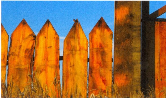
Baudetail des Limestores Öhringen vor dem Anstrich: Aus heutiger Sicht harmonische Natürlichkeit mit Eichenholz, Rotkehlchen und Lampenputzergras.

Es gibt keine Holzreste vom Limes, an denen Farbspuren nachgewiesen worden wären. Aber wir wissen, dass römischer Steinarchitektur Farbe verliehen wurde. Entsprechend waren die Steinbauten am Limes dekorativ gestaltet. Es spricht deshalb viel dafür, dass die Holzbauten ebenfalls eine farbige Fassung trugen, auch am Limes. Deshalb wird hier ein Analogieschluss präsentiert, zumal die Ausrüstung und Architektur des römischen Militärs bunt war, und nicht wie heute feldgrau oder tarnfarben.