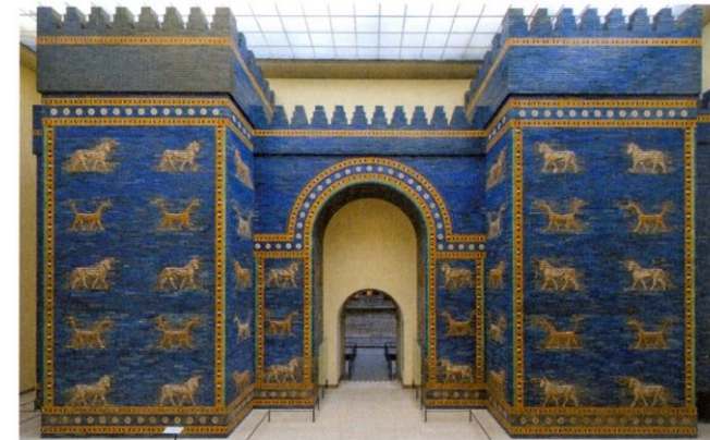
Berühmtes farbiges Tor aus der Antike: das Ishtar-Tor von Babylon (Pergamonmuseum, Berlin).