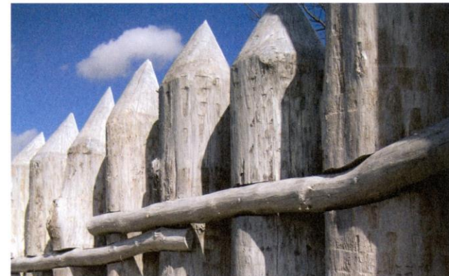
Rückseite der Rekonstruktion des Limestores Öhringen ganz in Weiß.

Das Gebiet östlich des Rheins und nördlich der Donau gehört im 1.–3. Jahrhundert nach Christus rund 200 Jahre zwei römischen Provinzen an: Raetien und Obergermanien. Selbstverständlich schafften die Römer Rahmenbedingungen für eine gute Entwicklung dieser Territorien. Deshalb wird zwischen Rhein und Donau am Rand beider Provinzen, der den Germanen zugewandt ist, ein vom Militär kontrollierter Geländestreifen (limes) festgelegt: der 550 km lange Obergermanisch-Raetische Limes.