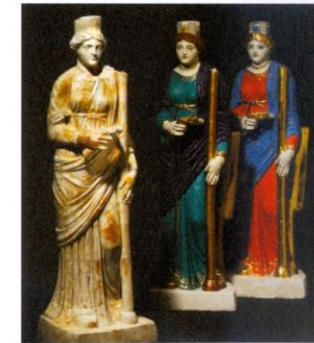
Marmorstatuette der Dea Annona (Göttin des jährlichen Ernteertrags) aus dem Tempelbezirk von Thun-Allmendingen und rekonstruierte Farbfassungen (Bernisches Historisches Museum, Bern).

Farbvorbilder für ein Limestor gibt es nicht, weshalb der Bemalung der Torflügel eine spezielle Systematik zugrunde liegt. Die unteren Partien der Torflügel sind farblich der diesseitigen Welt verhaftet: Braun für den Boden und die Erde sowie Grün für die Vegetation. Die oberen Bereiche sind farblich dem Himmel zugetan: blau mit gelben Andreaskreuzen. Ein Gelb, das für die Sonne, den Mond und die Sterne steht. Die Gestaltung der Palisade orientiert sich am Dekorschema von Wänden und Säulen, die oft über weiße Flächen mit roter Sockelzone verfügten. Dabei wurde der rote Sockel der Palisade auch über den Torrahmen samt Mittelpfosten geführt. Im Kontrast zur Vorderseite steht die ganz in Weiß gehaltene Rückseite. Die Seite, die den Germanen zugewandt war, bildete die repräsentative Fassade.